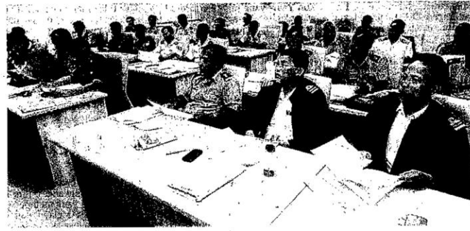
PESERTA kursus mengikuti kelas di Pusat Pengaman Malaysia.

kira-kira 2.4 hektar di Kem Segenting, Batu 9, Port Dickson telah dibina pada awal tahun 2002.